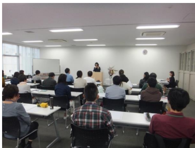
産業カウンセラー養成講座最終日 愛媛